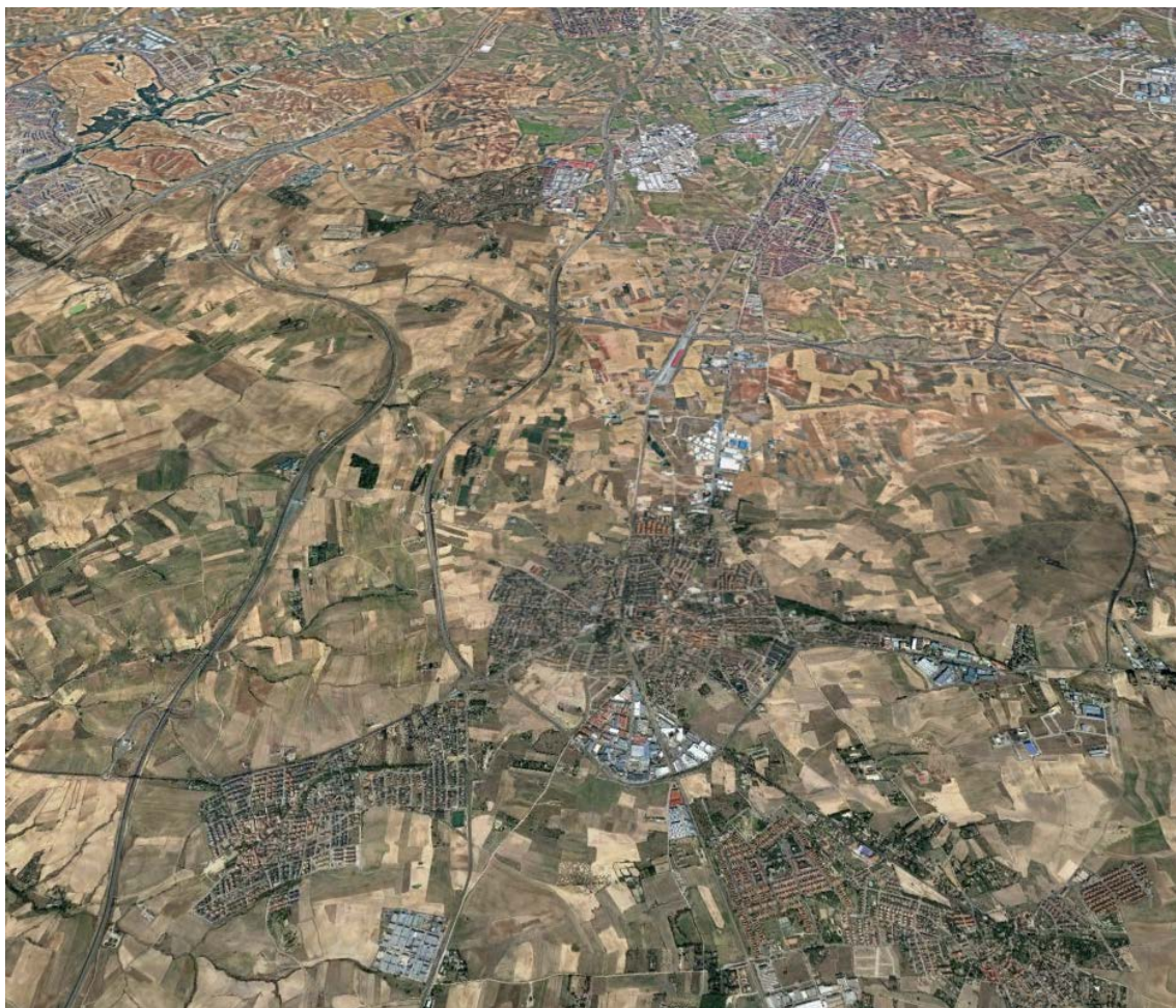
Vista general desde Serranillos del Valle hacia Moraleja de Enmedio.

Este documento es copia original firmado. Se han ocultado datos personales en aplicación de la normativa vigente