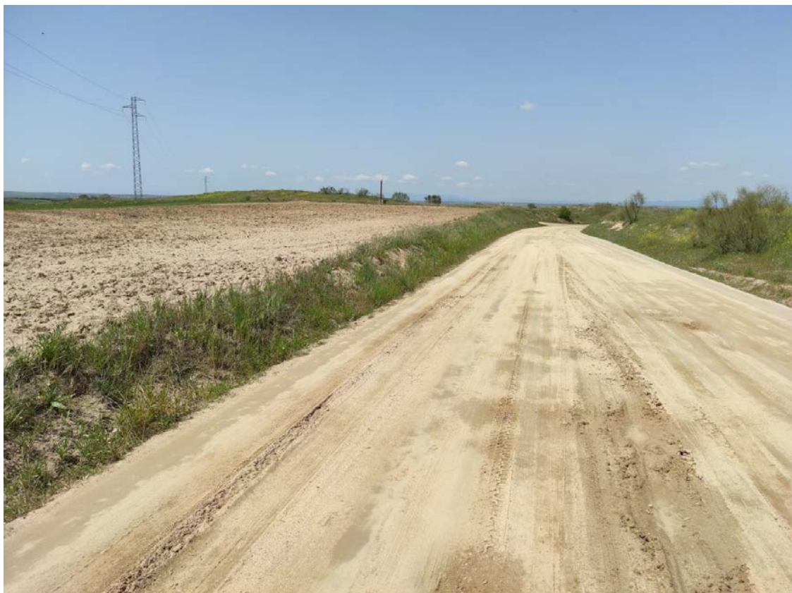
Camino de acceso al apoyo T-062

Este documento es copia original firmado. Se han ocultado datos personales en aplicación de la normativa vigente