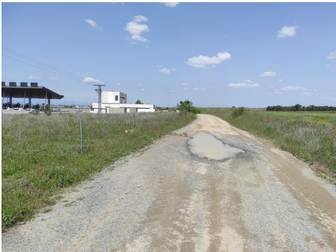
Camino de acceso al apoyo T-072

Este documento es copia original firmado. Se han ocultado datos personales en aplicación de la normativa vigente