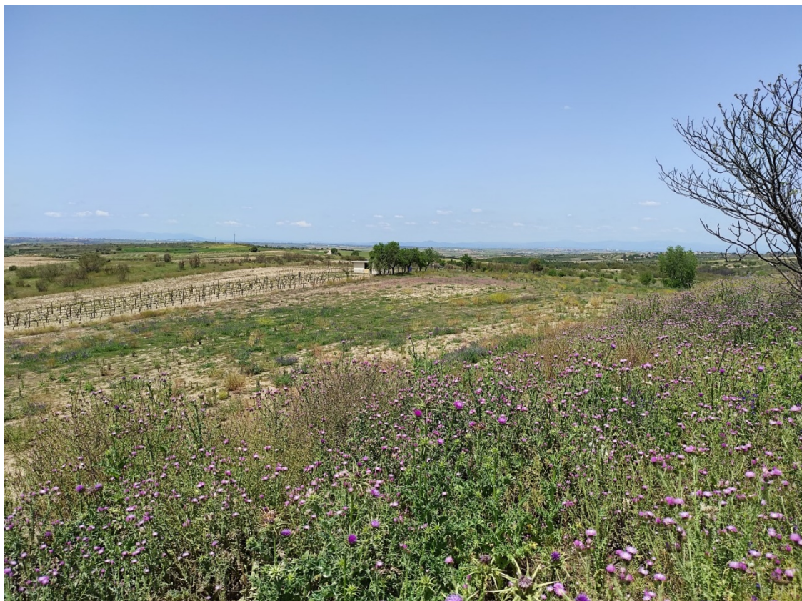
Parcela de ubicación del apoyo T-053

Este documento es copia original firmado. Se han ocultado datos personales en aplicación de la normativa vigente