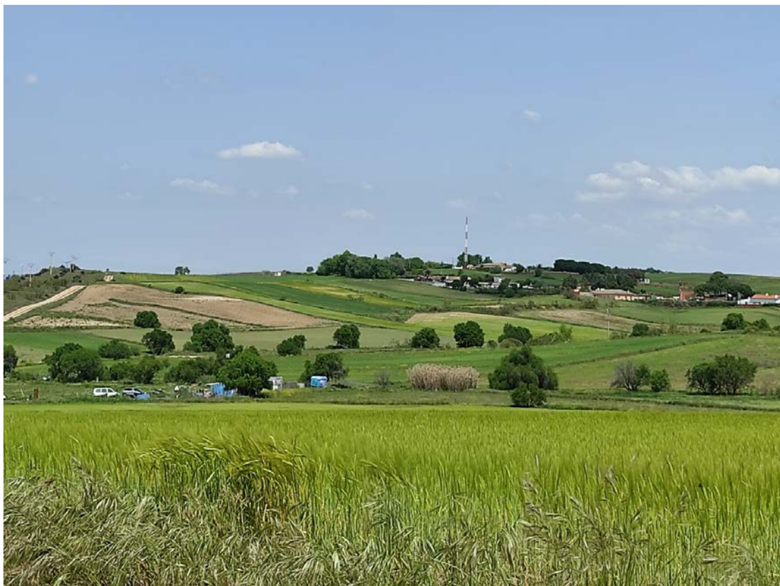
Detalla del trazado hacia los apoyos T-068 y T-069

Este documento es copia original firmado. Se han ocultado datos personales en aplicación de la normativa vigente