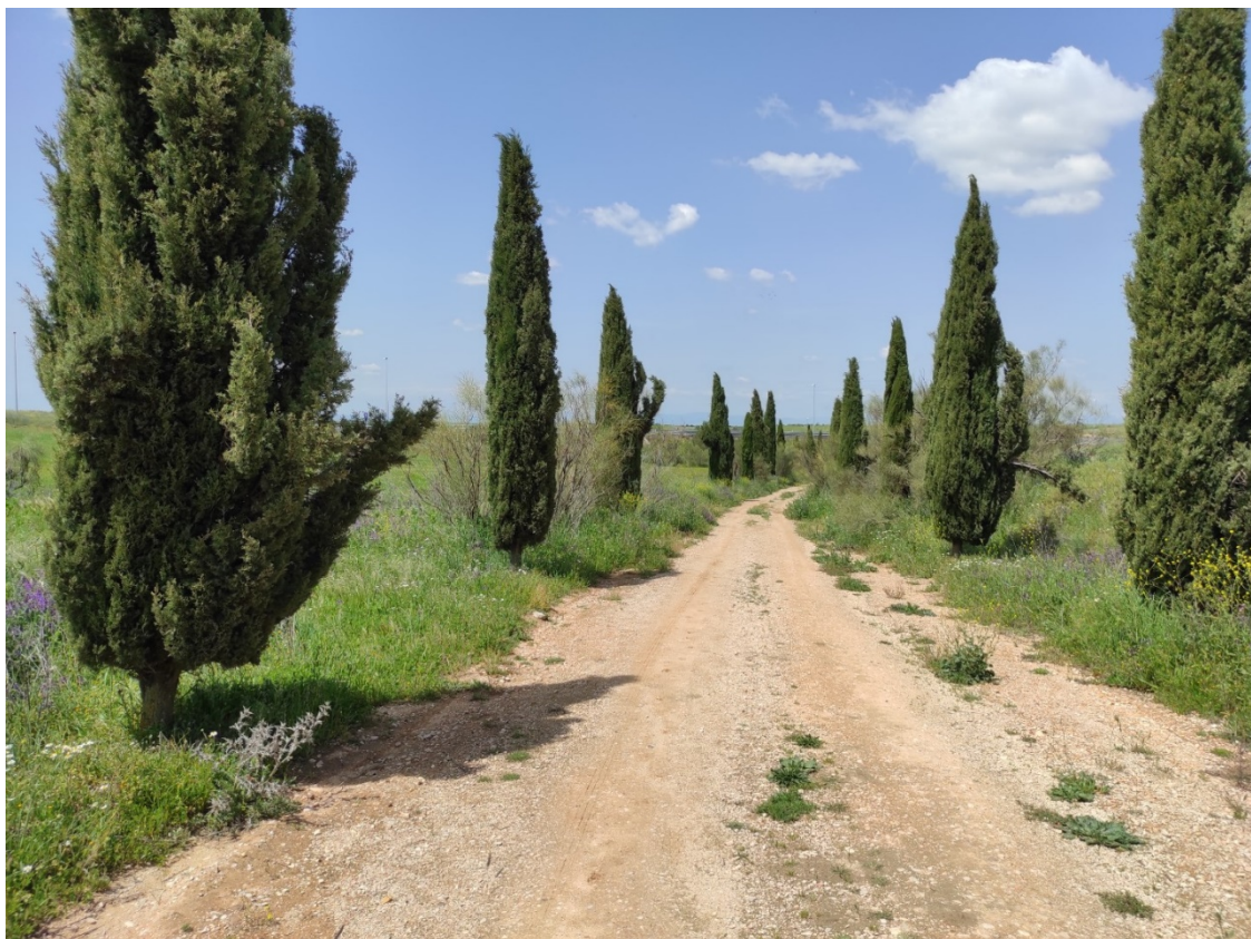
Camino que cruzará la traza soterrada en dirección al apoyo T-065 PAS

Este documento es copia original firmado. Se han ocultado datos personales en aplicación de la normativa vigente