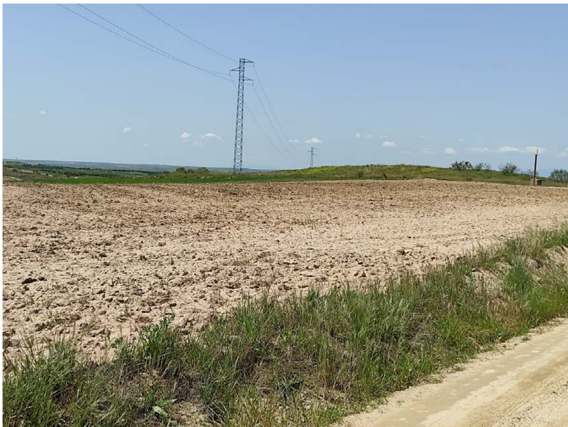
Acceso al apoyo T-062

Este documento es copia original firmado. Se han ocultado datos personales en aplicación de la normativa vigente