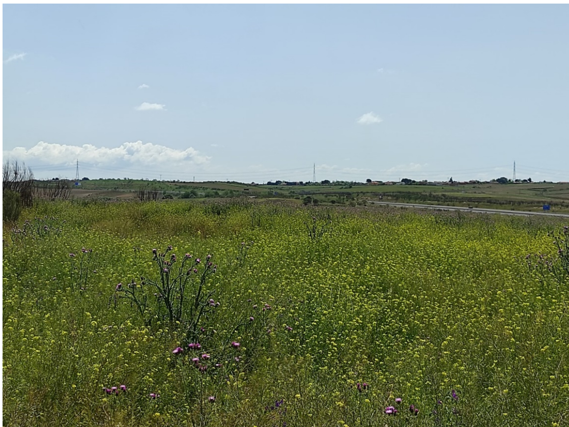
Vista de del trazado desde los apoyos T-052, T-053 y T-054

Este documento es copia original firmado. Se han ocultado datos personales en aplicación de la normativa vigente