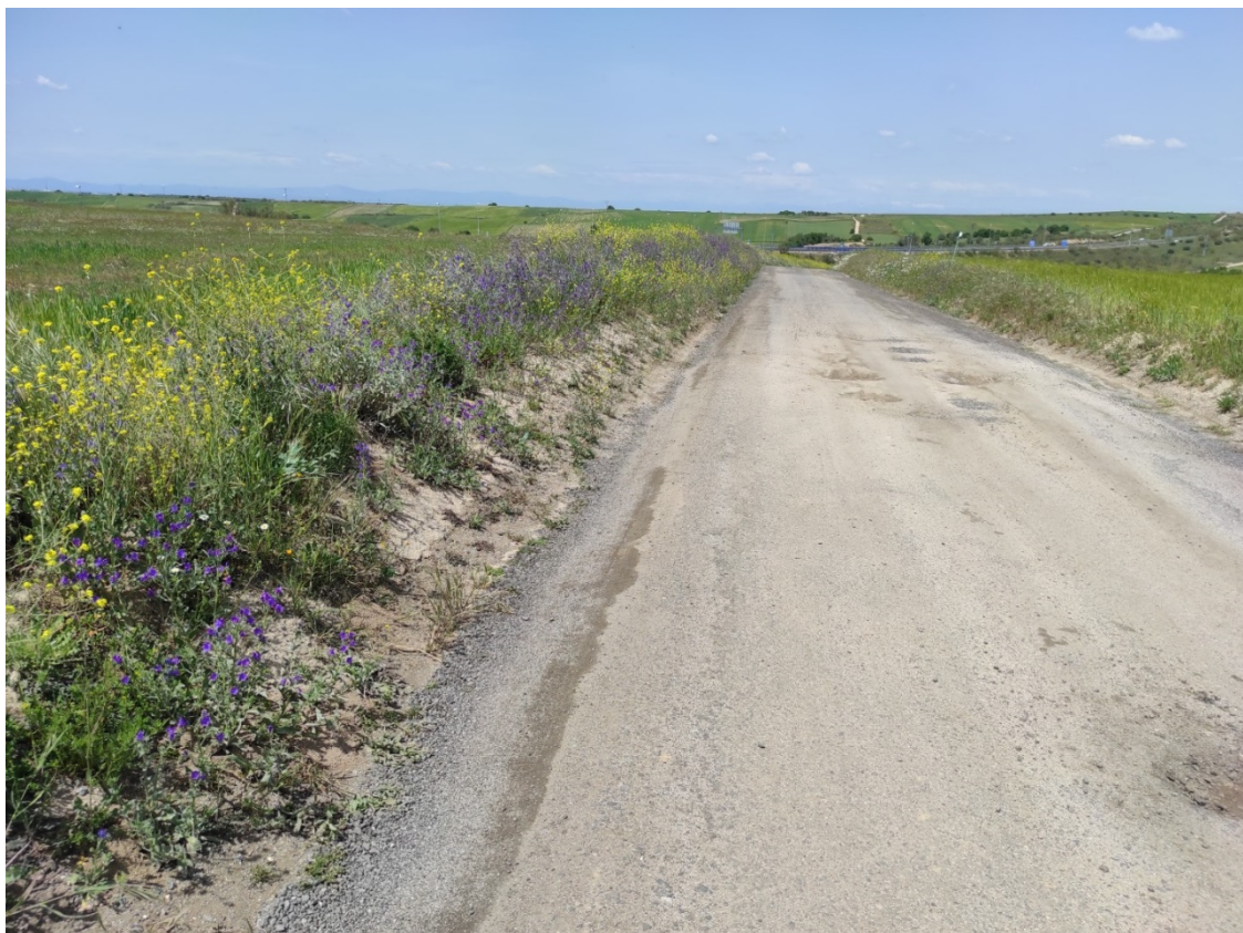
Camino de acceso al apoyo T-066

Este documento es copia original firmado. Se han ocultado datos personales en aplicación de la normativa vigente