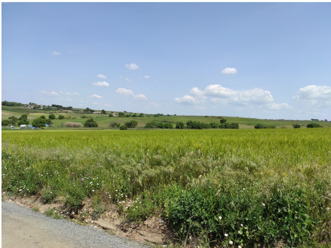
Ubicación del apoyo T-067

Este documento es copia original firmado. Se han ocultado datos personales en aplicación de la normativa vigente