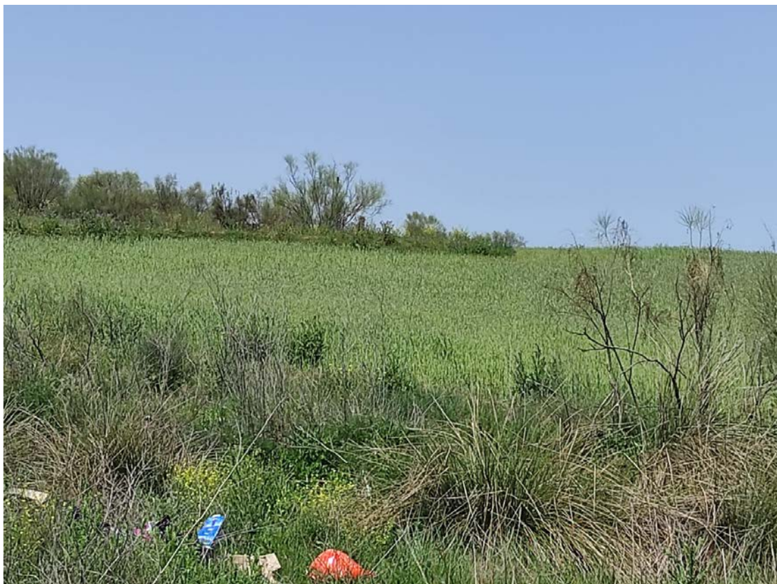
Parcela de ubicación del apoyo T-094

Este documento es copia original firmado. Se han ocultado datos personales en aplicación de la normativa vigente