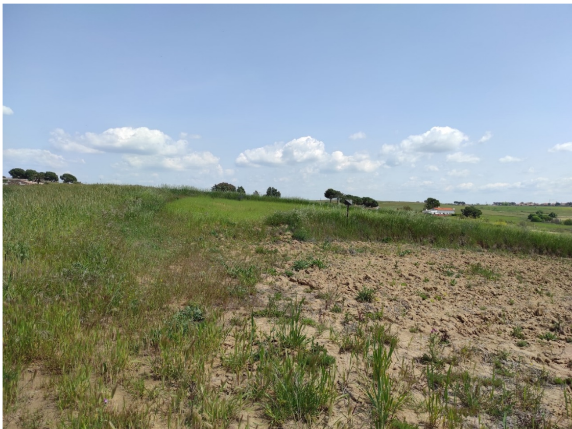
Ubicación del apoyo T-069.

Este documento es copia original firmado. Se han ocultado datos personales en aplicación de la normativa vigente