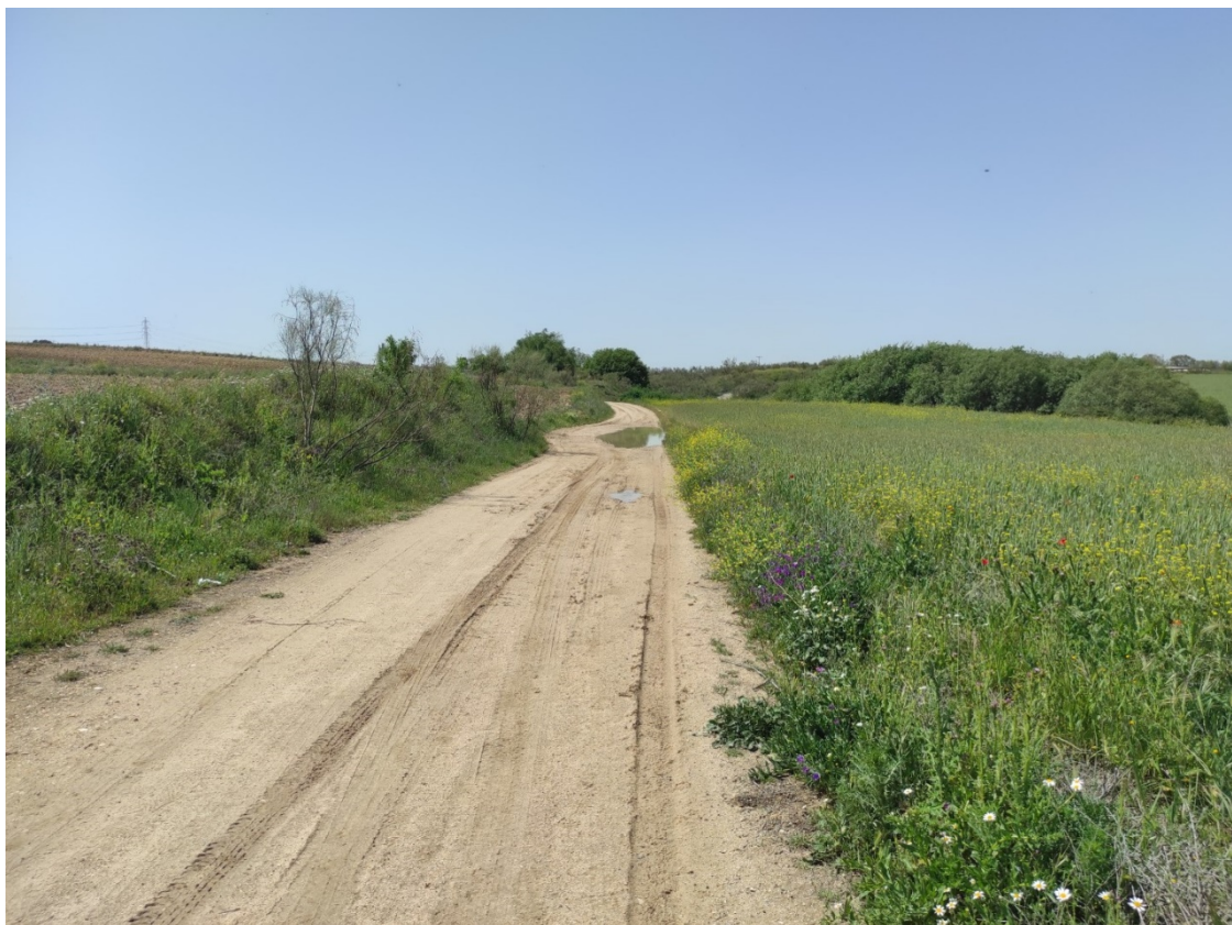
Camino de acceso al apoyo T-094 desde la urbanización Coto del Zagal de Carranque

Este documento es copia original firmado. Se han ocultado datos personales en aplicación de la normativa vigente