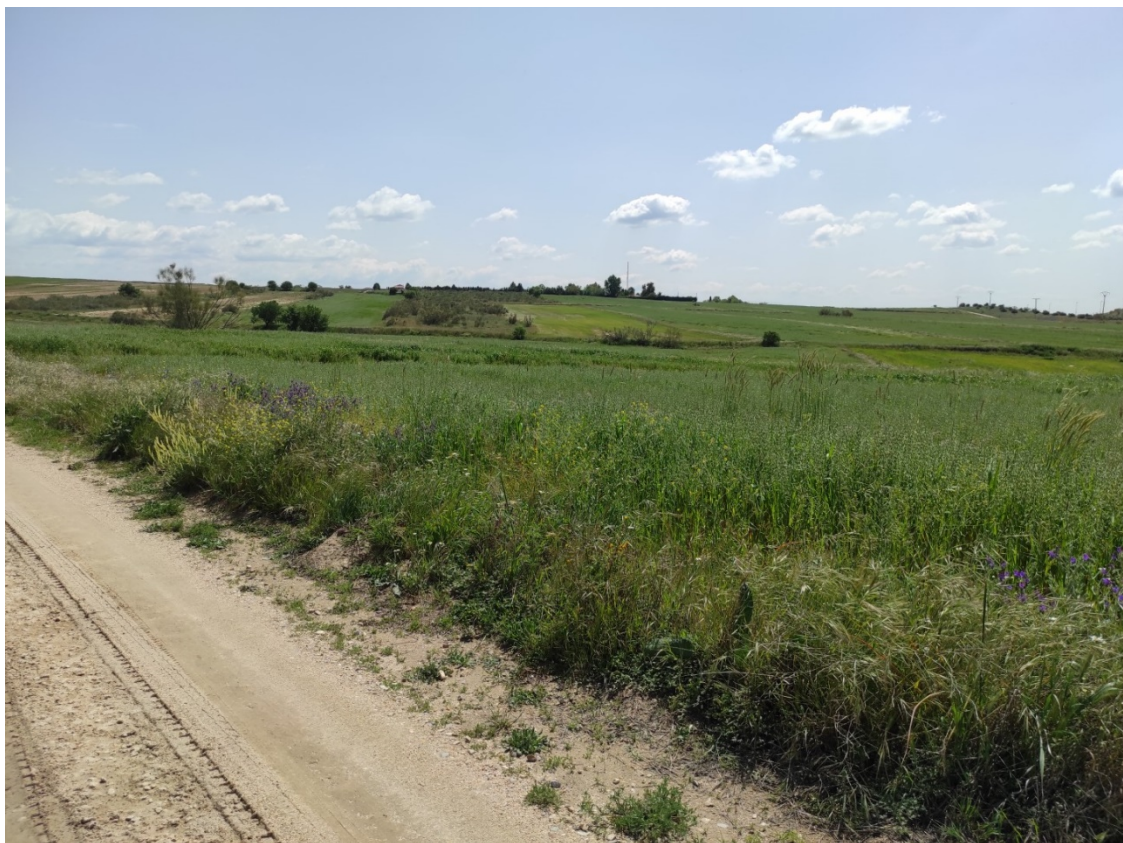
Ubicación del apoyo T-073 PAS

Este documento es copia original firmado. Se han ocultado datos personales en aplicación de la normativa vigente