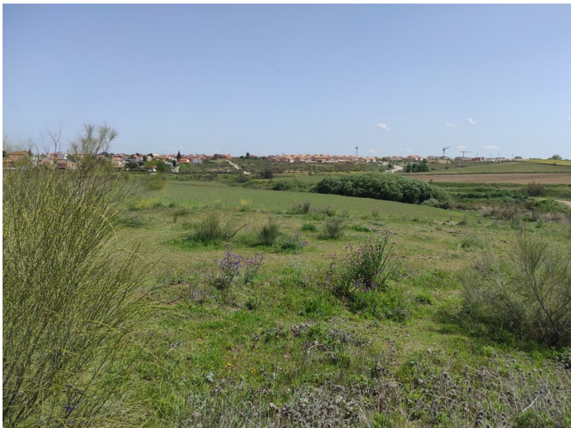
Parcela de ubicación del apoyo T-052, y al fondo la urb Coto del Zagal de Carranque

Este documento es copia original firmado. Se han ocultado datos personales en aplicación de la normativa vigente