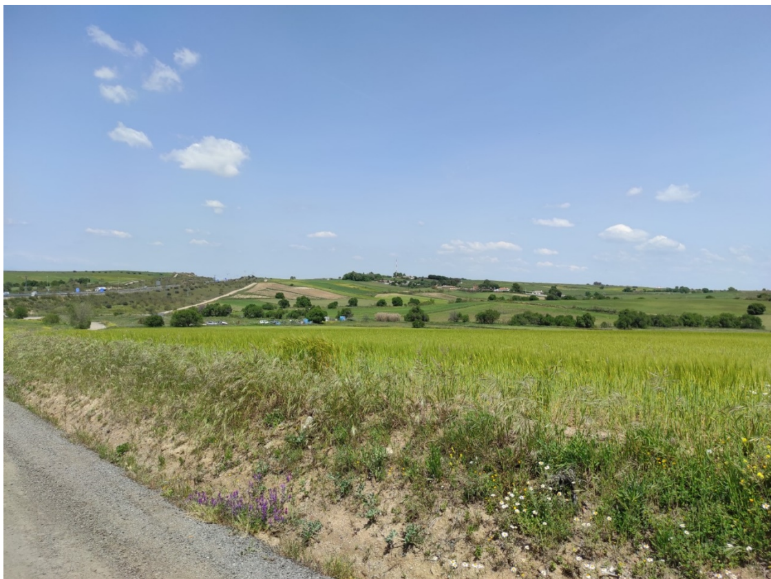
Acceso al apoyo T-067

Este documento es copia original firmado. Se han ocultado datos personales en aplicación de la normativa vigente