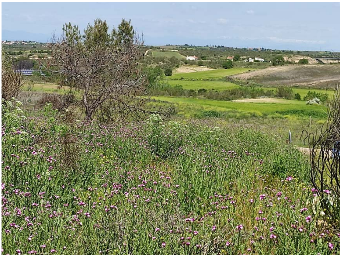
Trazado de la LAT hacia los apoyos T-056 y T-057, salvando el arroyo del Carcavón (en el centro de la fotografía).

Este documento es copia original firmado. Se han ocultado datos personales en aplicación de la normativa vigente