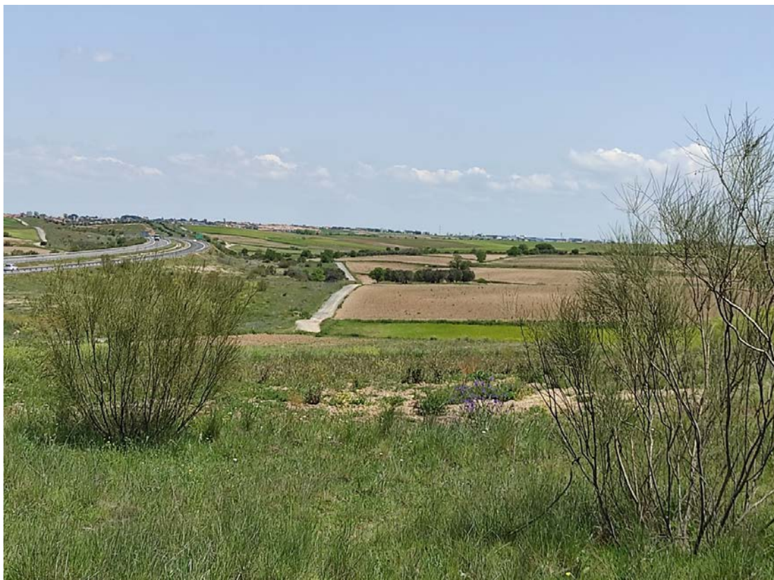
Detalle del trazado de la LAT desde el apoyo T-062 hacia el T-063 y T-064 PAS de soterramiento

Este documento es copia original firmado. Se han ocultado datos personales en aplicación de la normativa vigente