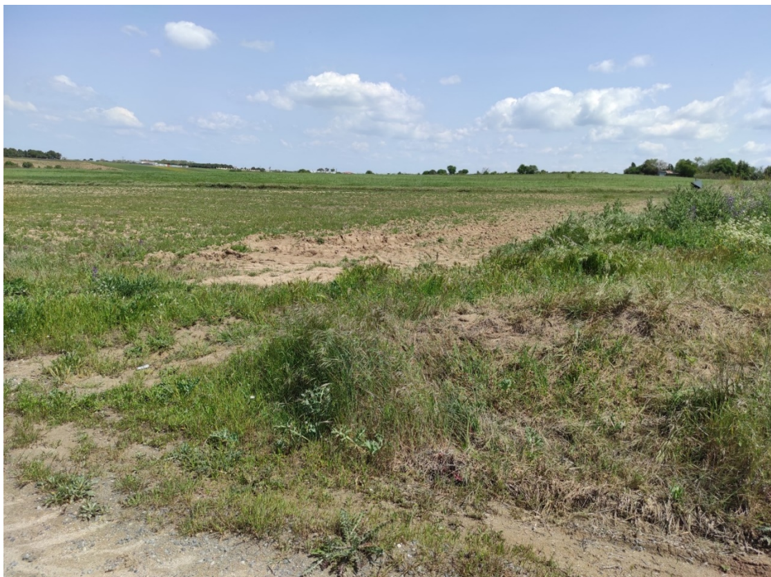
Ubicación del apoyo T-071

Este documento es copia original firmado. Se han ocultado datos personales en aplicación de la normativa vigente