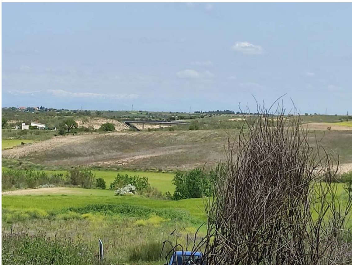
Detalle del trazado de la LAT hacia los apoyos T-056, T-057 y T-058

Este documento es copia original firmado. Se han ocultado datos personales en aplicación de la normativa vigente