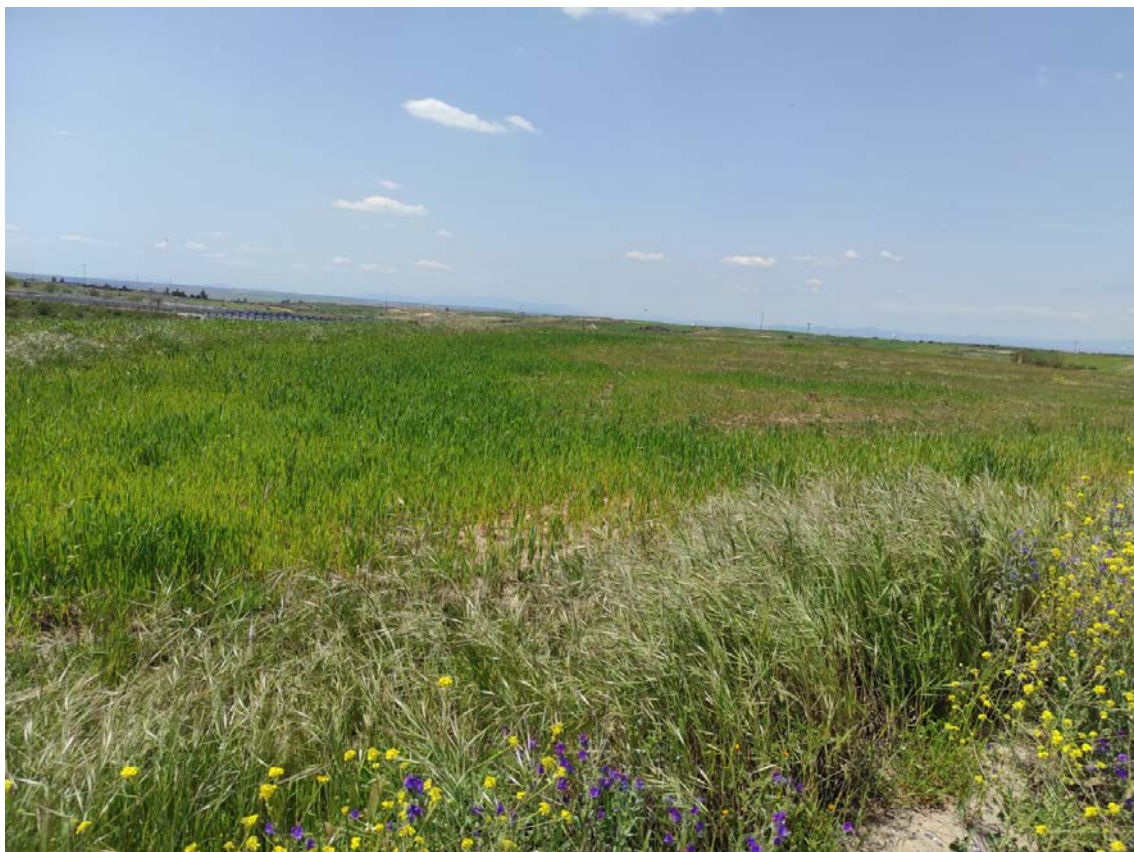
Ubicación del apoyo T-066

Este documento es copia original firmado. Se han ocultado datos personales en aplicación de la normativa vigente