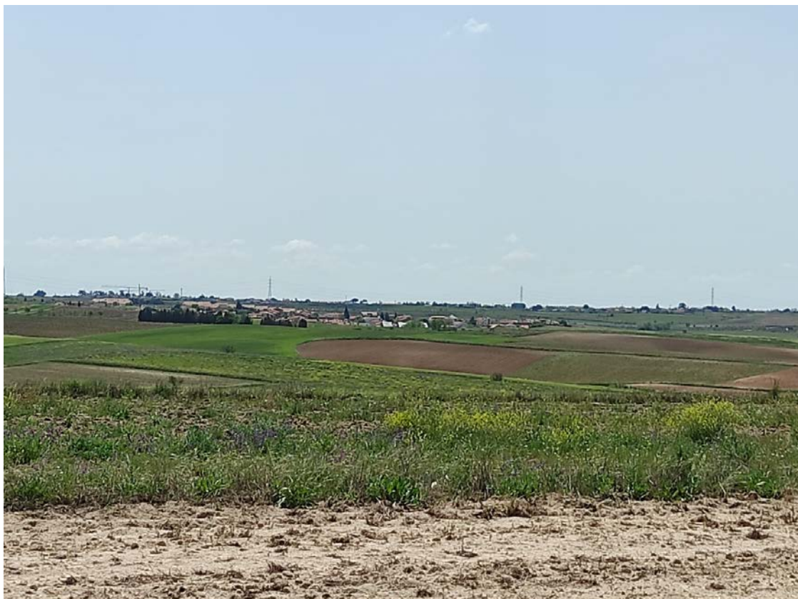
Detalle del trazado de la LAT desde los apoyos T-059, T-060 y T-061 hacia el T-062

Este documento es copia original firmado. Se han ocultado datos personales en aplicación de la normativa vigente