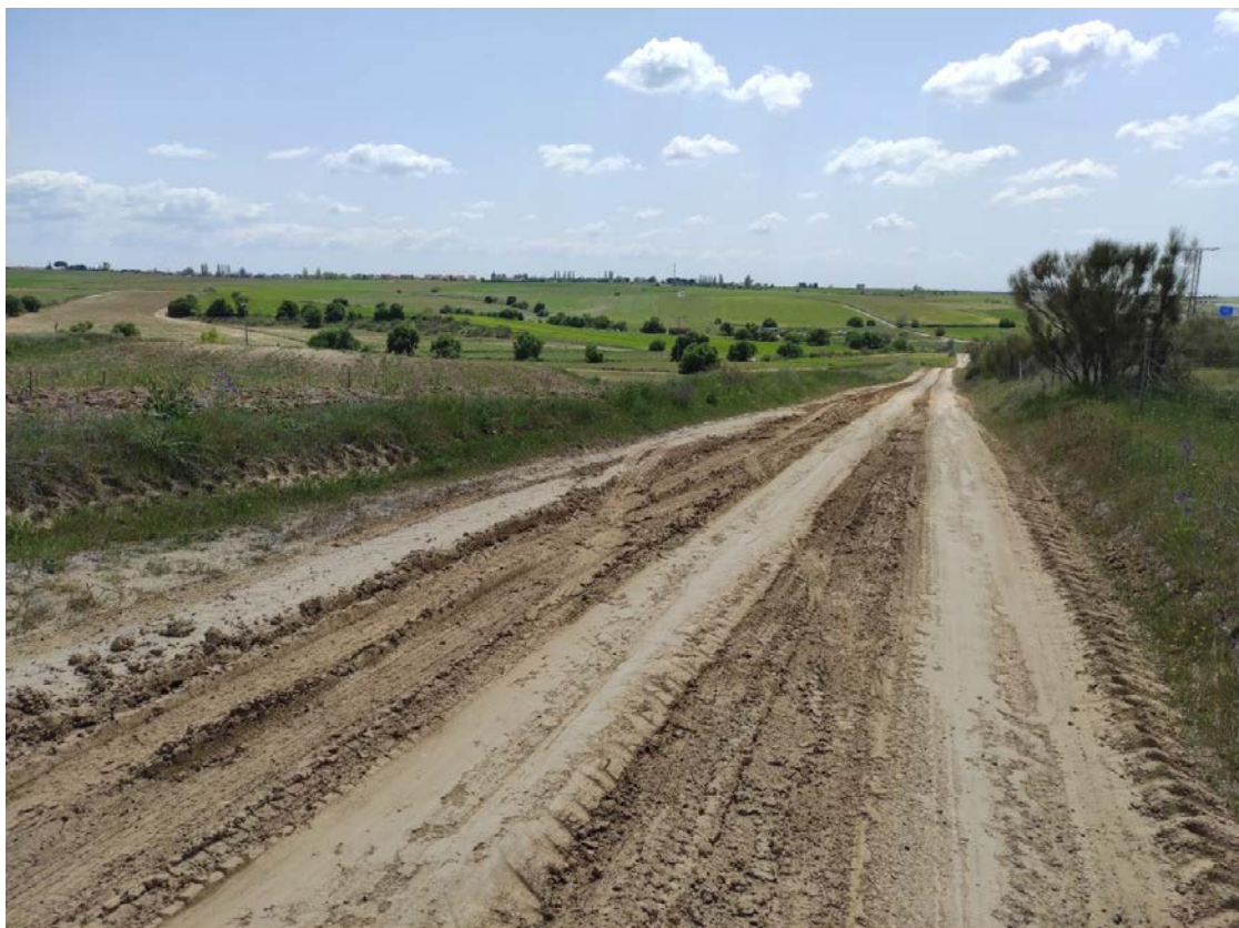
Camino de acceso al apoyo T-069

Este documento es copia original firmado. Se han ocultado datos personales en aplicación de la normativa vigente