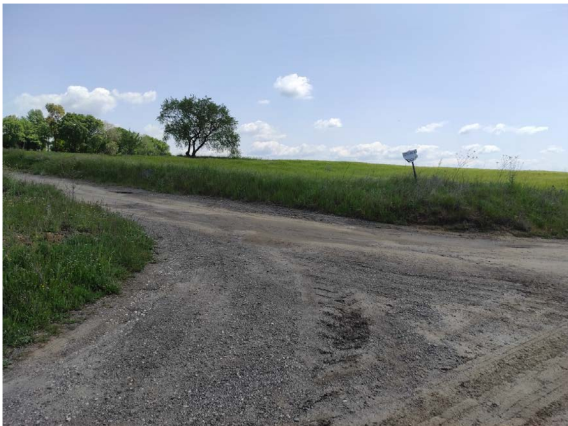
Camino de acceso al apoyo T-070

Este documento es copia original firmado. Se han ocultado datos personales en aplicación de la normativa vigente