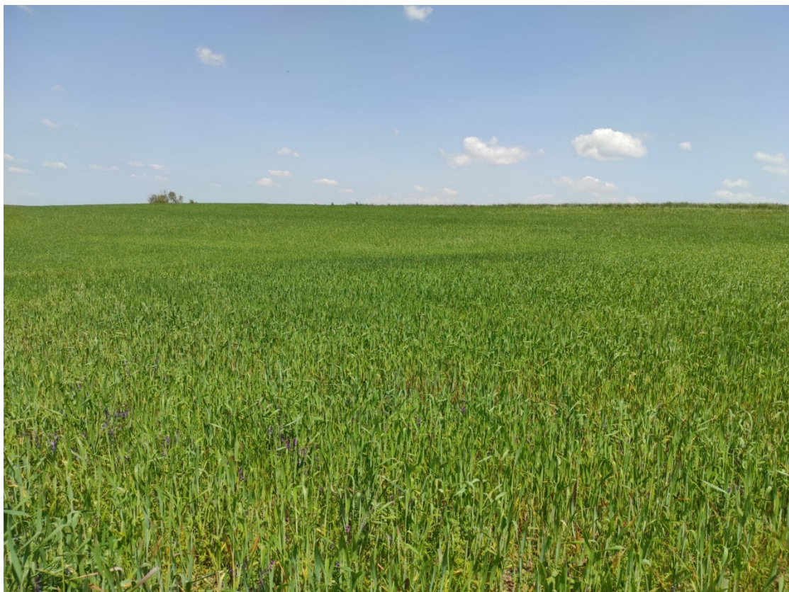
Ubicación del apoyo T-065 PAS

Este documento es copia original firmado. Se han ocultado datos personales en aplicación de la normativa vigente