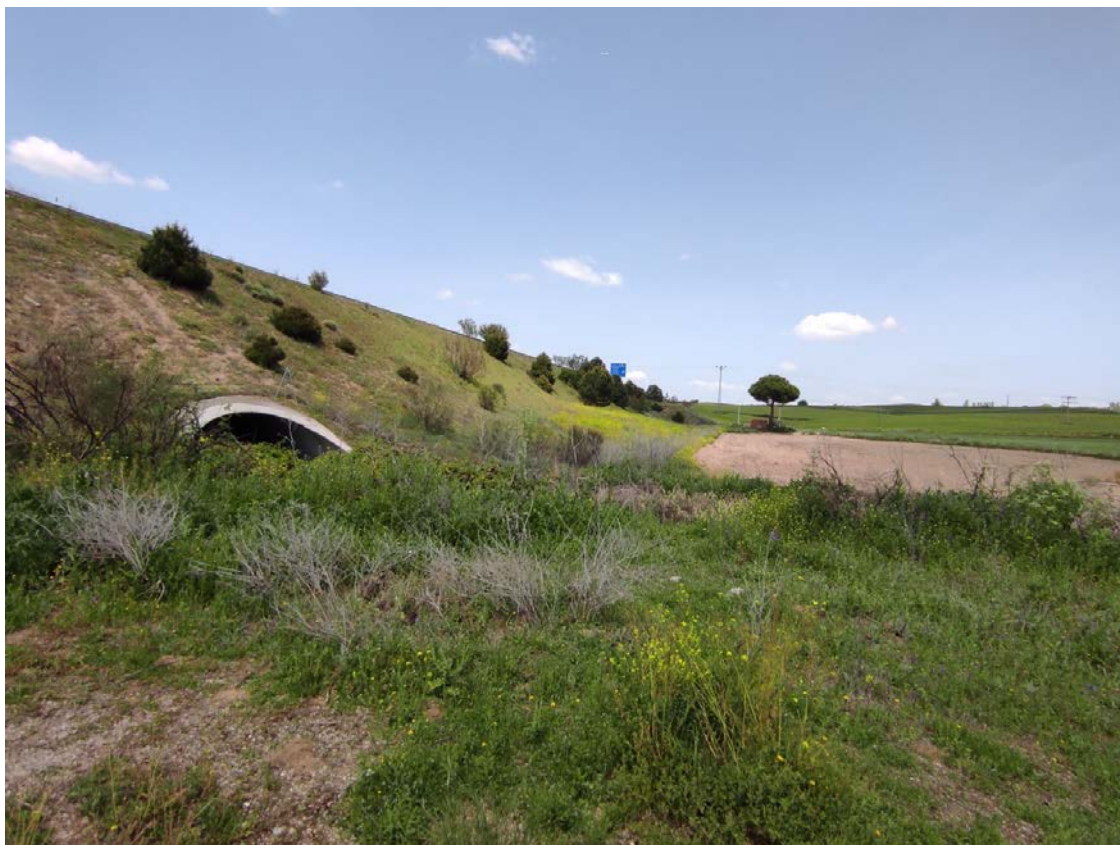
Trazado de la línea soterrada junto a la autovía AP-41

Este documento es copia original firmado. Se han ocultado datos personales en aplicación de la normativa vigente