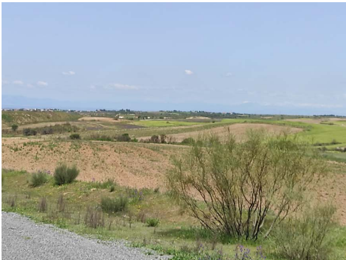
Trazado de la LAT desde el apoyo T-052 hacia el T-053

Este documento es copia original firmado. Se han ocultado datos personales en aplicación de la normativa vigente