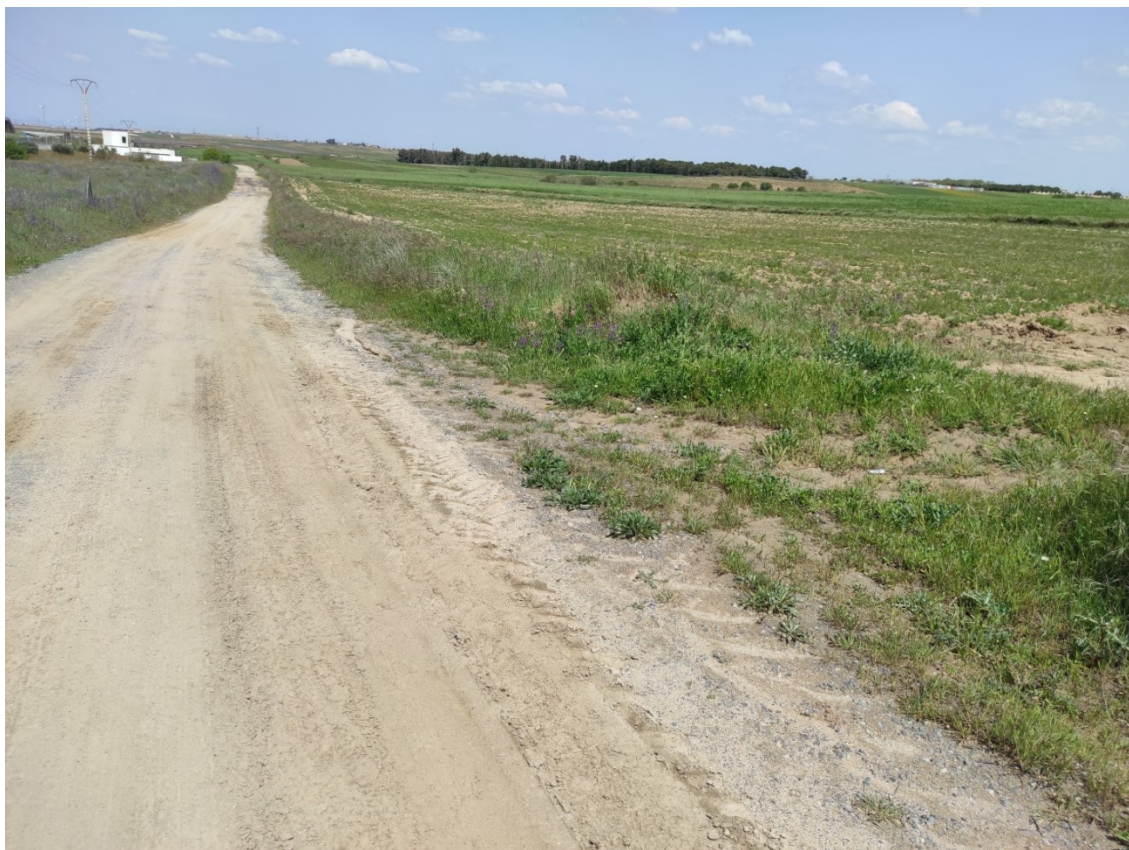
Camino de acceso al apoyo T-071

Este documento es copia original firmado. Se han ocultado datos personales en aplicación de la normativa vigente