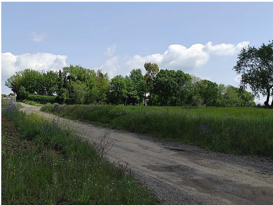
Ubicación del apoyo T-070

Este documento es copia original firmado. Se han ocultado datos personales en aplicación de la normativa vigente