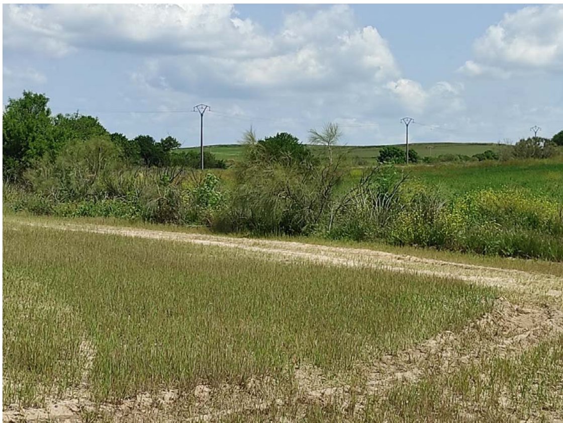
Ubicación del apoyo T-068

Este documento es copia original firmado. Se han ocultado datos personales en aplicación de la normativa vigente