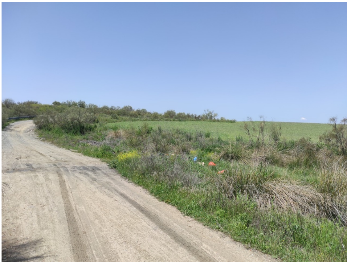
Acceso a la parcela del apoyo T-094

Este documento es copia original firmado. Se han ocultado datos personales en aplicación de la normativa vigente