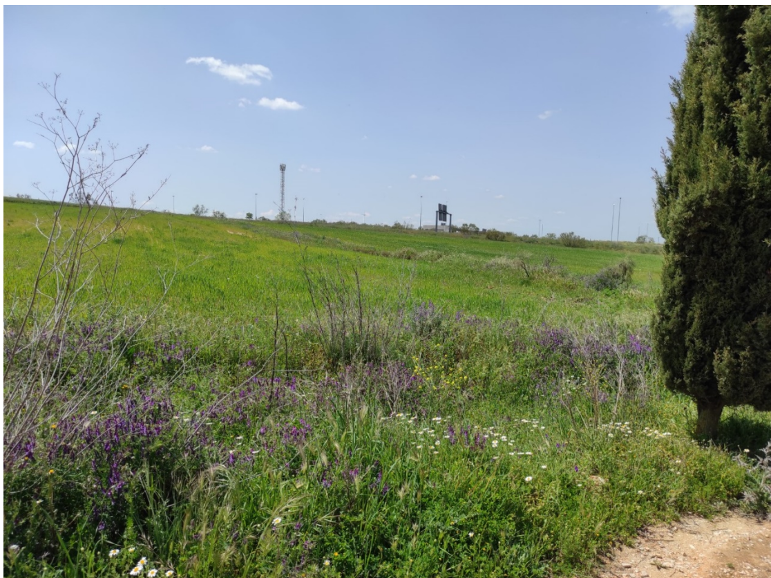
Detalle del trazado soterrado desde la AP-41 (al fondo) en dirección al apoyo T-065 PAS

Este documento es copia original firmado. Se han ocultado datos personales en aplicación de la normativa vigente