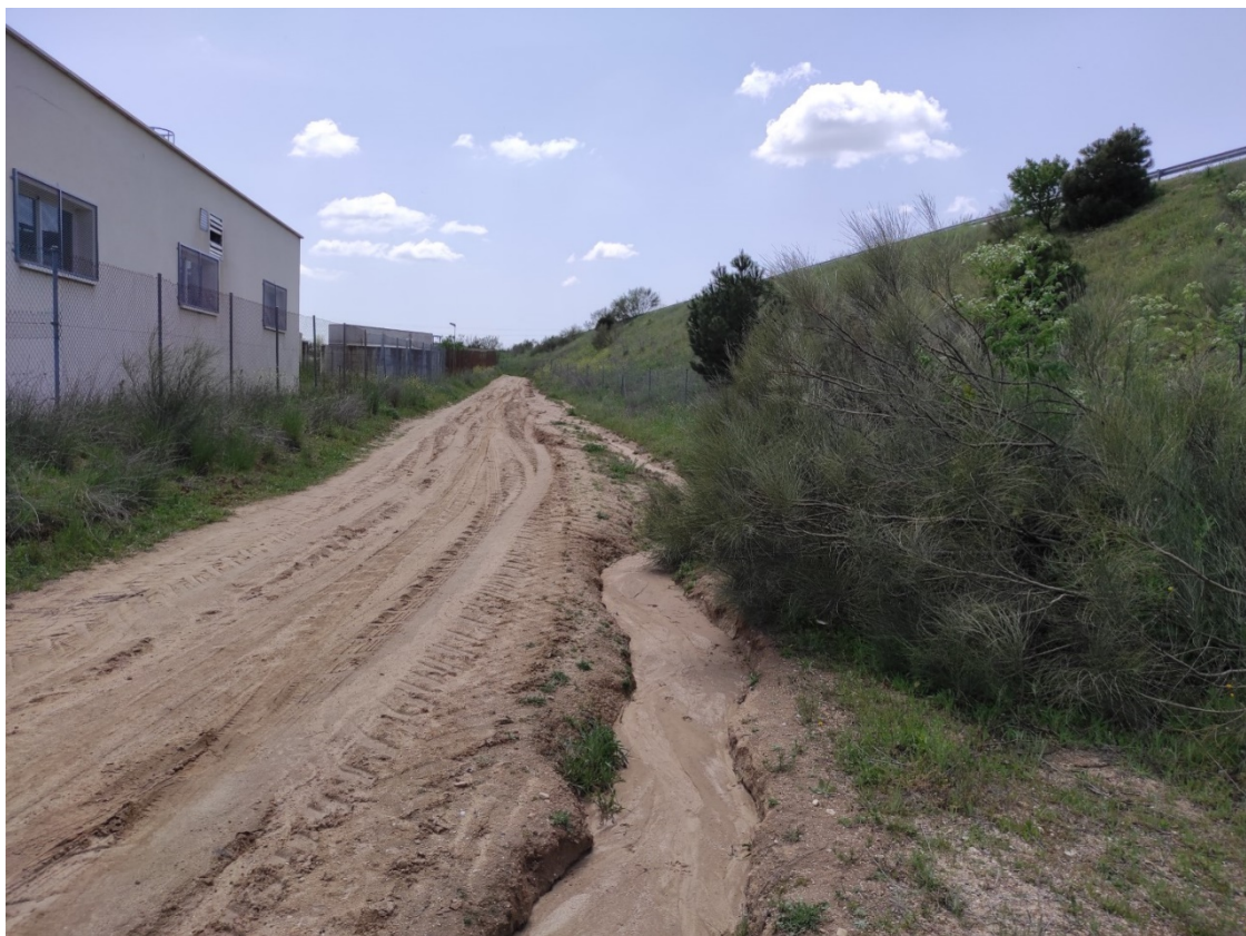
Camino junto a la EDAR de Serranillos del valle, por donde vendrá soterrada la LAT

Este documento es copia original firmado. Se han ocultado datos personales en aplicación de la normativa vigente