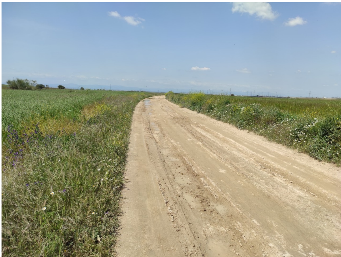
Camino por donde transcurrirá el último tramo soterrado de la LAT

Este documento es copia original firmado. Se han ocultado datos personales en aplicación de la normativa vigente