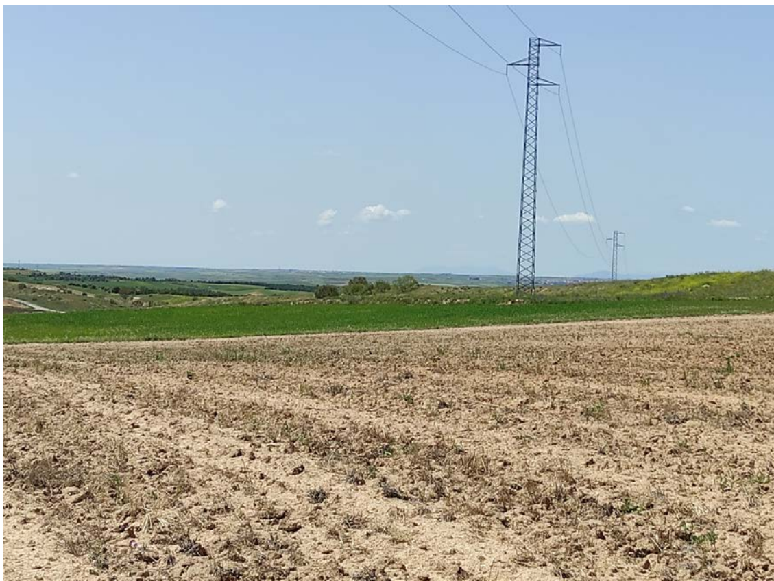
Parcela de ubicación del apoyo T-062

Este documento es copia original firmado. Se han ocultado datos personales en aplicación de la normativa vigente