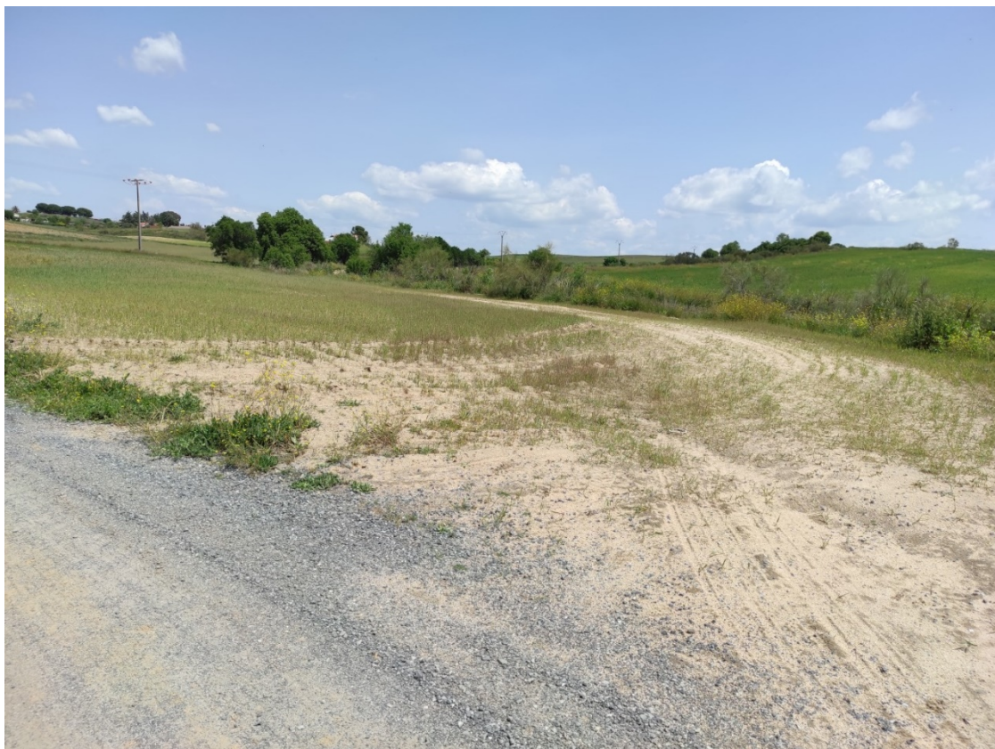
Acceso al apoyo T-068

Este documento es copia original firmado. Se han ocultado datos personales en aplicación de la normativa vigente